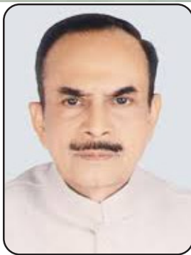
मो. मेहमूद (गृहमंत्री-तेलंगाना)

एडिटर के दूसरे सवाल पूछने पर क्या आपने टाईम से पहले सरकार को निरस्त करने की वजह क्या थी? इस पर उन्होंने बताया कि हमने चार साढ़े चार साल में बहुत काम